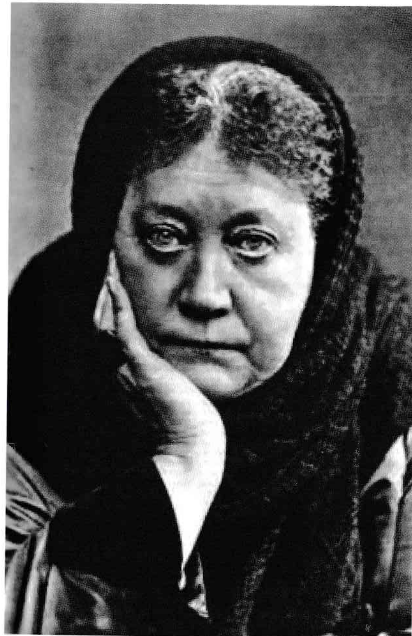
H.P. Blavatsky în 1889